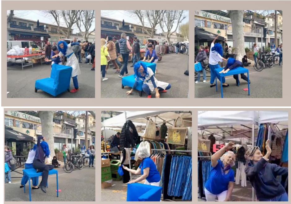
ARLES BLEU MARS 2024 (youtube.com)