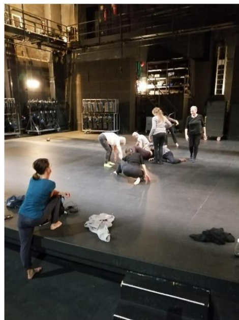
Une des répétitions au théâtre d'Arles