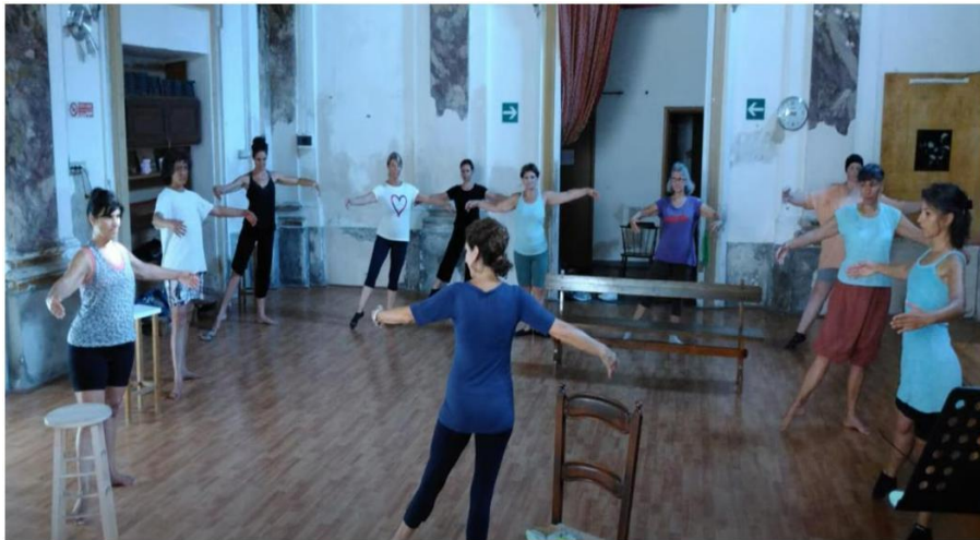
Voyage dansé à Florence. Vidéo Juillet 2022.

https://www.youtube.com/watch?v=iN4WbaWW8bE&t=1s